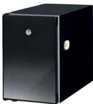
LODÓWKA NA MLEKO