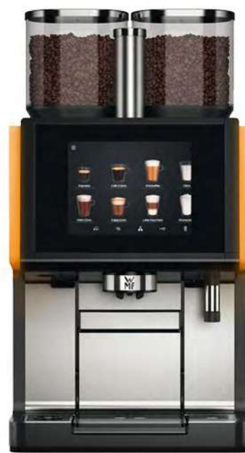
WMF 9000 S+