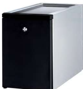
LODÓWKA NA MLEKO