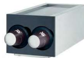
PODAJNIK NA KUBKI PAPIEROWE