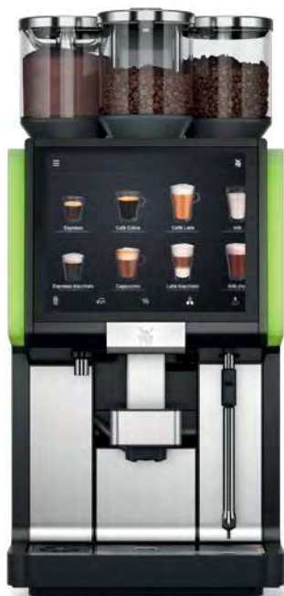
WMF 5000 S+