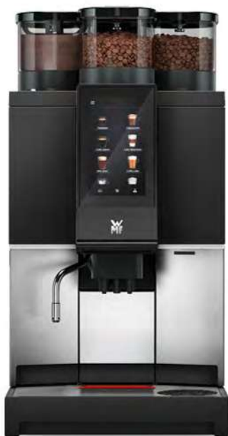
WMF 1300 S