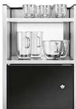
LODÓWKA NA MLEKO Z PODGRZEWACZEM FILIŻANEK