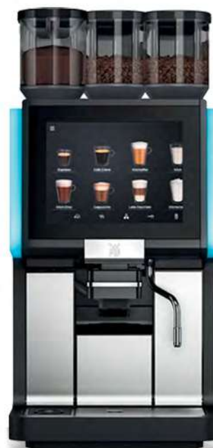
WMF 1500 S+